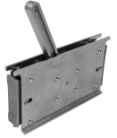
Herramientas de soporte Roxtec